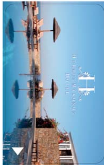
Έκταση 2mm σε κάρτα με εικόνα σε όλη την επιφάνεια

Σημείωση: Καλό είναι στη μπροστινή όψη της κάρτας να τοποθετείται ένα βελάκι προς τη φορά εισόδου της κάρτας, έτσι ώστε να είναι ευνόητος ο τρόπος εισαγωγής στην κλειδαριά.